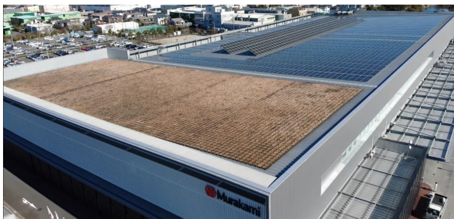
屋上に太陽光発電パネルを増設した築地工場

今後も再生可能エネルギーの利用拡大をはじめ、地球環境に配慮した取り組みに努めてまいります。